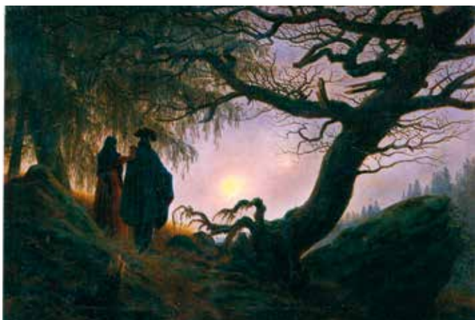
Mann und Frau in Betrachtung des Mondes von Caspar David Friedrich (um 1830)